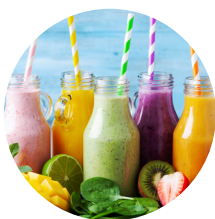
饮料 (即果味牛奶饮品)