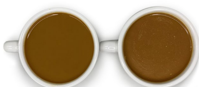
Lactorich Vers B2