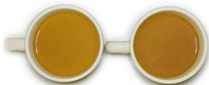
Lactorich Vers B2